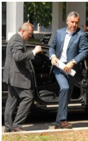
• Za Milov komfor 74.000

Developed by Beli&Boris - (c) 2005 "Dan"