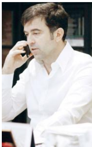
• Ministarstvo sponzoriralo Canetovu firmu „tešku“ 5,5 miliona eura