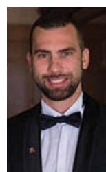
Ulama se smijao bratu ubijenog