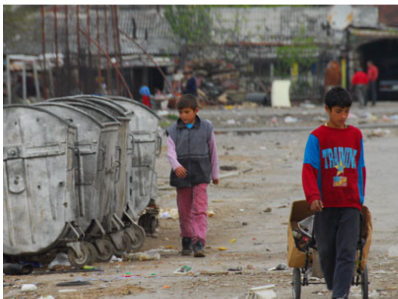
Romi među najugroženijima u zemlji