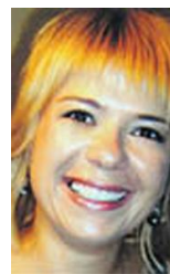
Dok pacijent umire, ljekari piju kafu