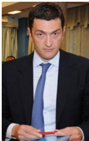
• Perović smijenjen, A2A preuzela finansije