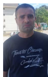
Majka osuđena, a sin oslobođen