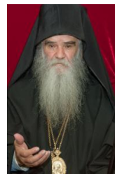
Sramota je što je premijer išao kod Tačija