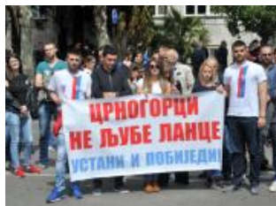
Traže ostavku Vlade i fer referendum