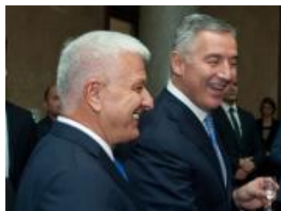
Za sedam godina pozajmili tri