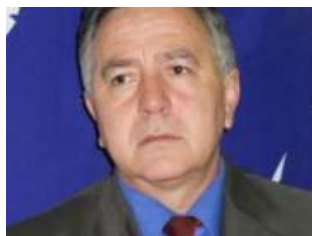
Akter „Snimka” vraćen u MUP