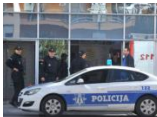
Lažna dojava ispraznila Deltu