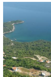
Rusi tužili Opštinu, traže 20 miliona