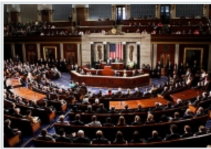
Предложена резолуција во Сенатот за поддршка на договорот за името