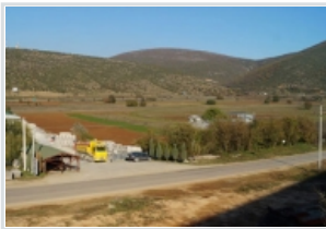
Нормализиран сообраќајот на патот Желино-Јегуновце кај Сирично